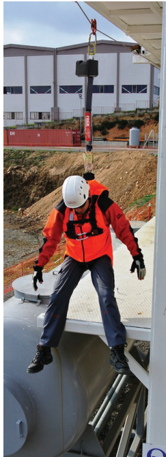
SATRA Technology Center No. CE 2777.

This Retractable Fall Arrester enables user to work safely by making a connection to a secure point with an appropriate tool. This Retractable Fall Arrester is manufactured in comply with standards of EN 360:2002 specified in the personal protective equipment directive 2016/425 and