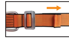
E.3 - Kolunu çekerek ayarlayınız. / Pull the webbing to adjust