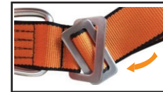
E.2 - Tokaları iç içe geçirin. / Connect the buckles together