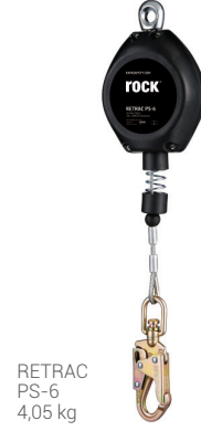
RETRAC PS-6 4,05 kg

Testeden Onaylı Kuruluş / Tested by Notified Body SATRA Technology Europe Limited. Bracetown Business Park, Clonee, D15 YN2P, Republic of Ireland. T: + 00 353 14372484